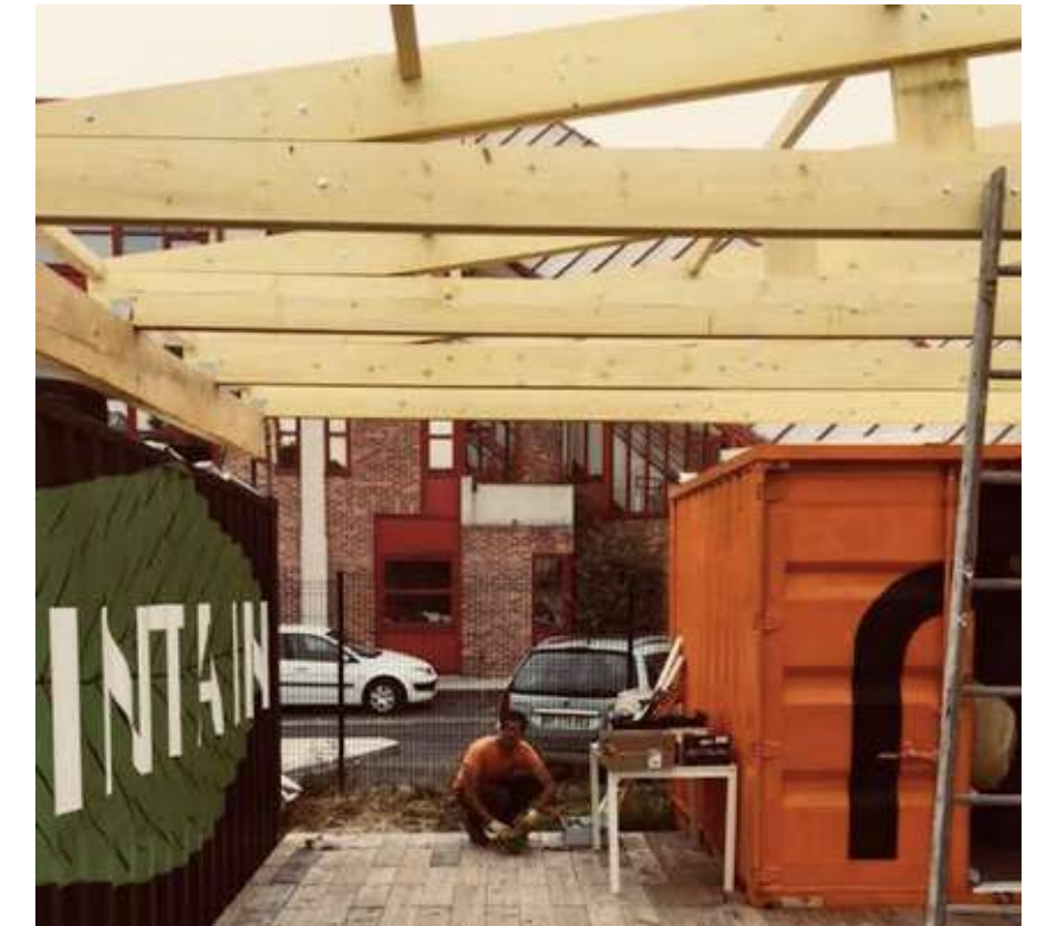
Chantier collectif en matériaux recyclés avec le collectif d'architectes Secousses