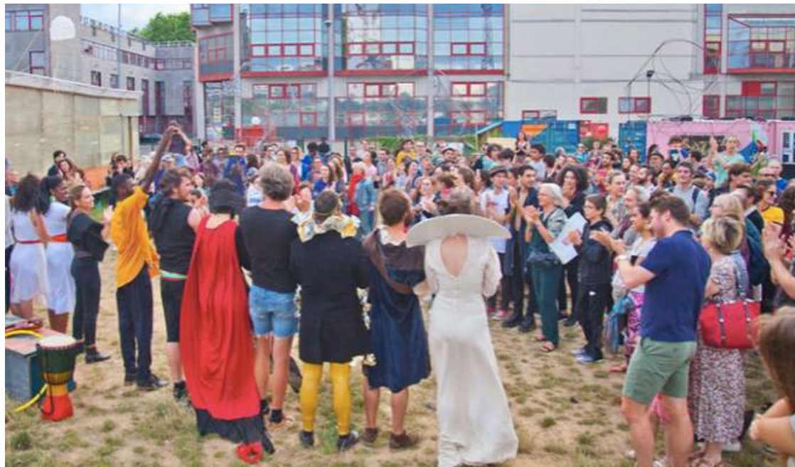
Restitution création artistique participative par la Cie Hoc Momento