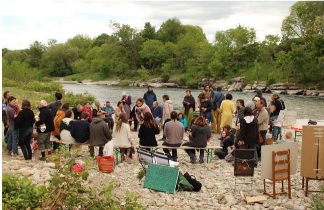
Réunion d'ouverture de la Commune Imaginée de Paiolive, Ardèche