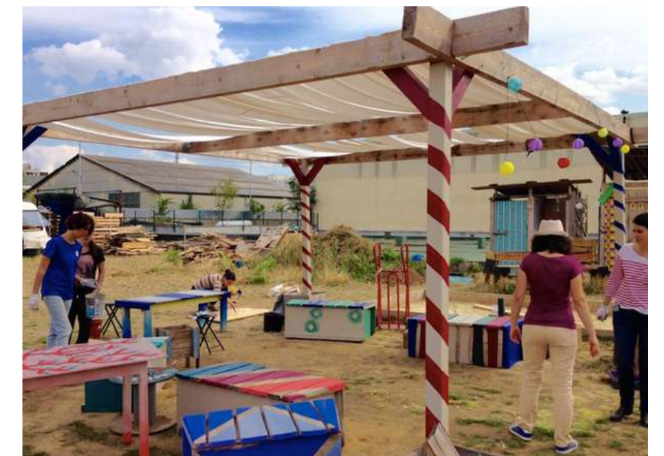
Chantier collectif en matériaux recyclés avec le collectif d'architectes Secousses