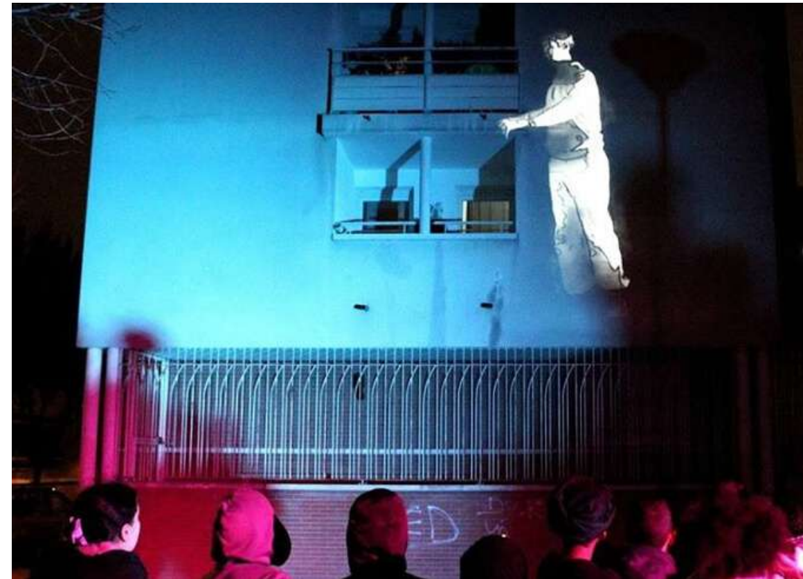
Création participative " La Haut le Cloud, ici le Soleil" par la Cie AADN