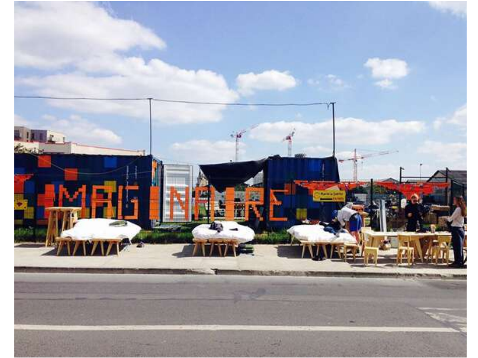
Traversée du 93 avec mobiliers conviviaux - avec l'artiste duo Bojeat.Renaud