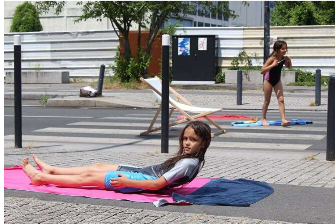
Croisière sur la Plaine, Saint - Denis (93)