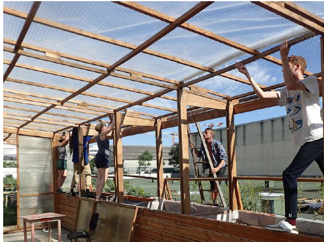
Chantier collectif de Serre bioclimatique en matériaux recyclés avec le collectif d'architectes La Gonflée