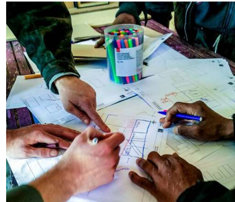
Conception collective de l'espace d'accueil des migrants de l'Espace Imaginaire